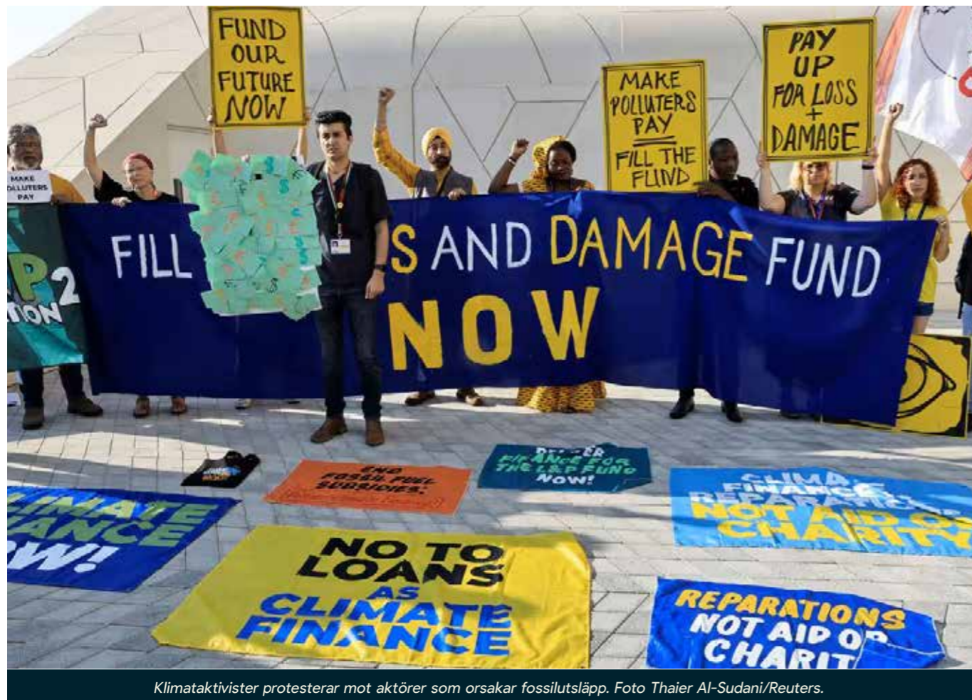
Klimataktivister protesterar mot aktörer som orsakar fossilutsläpp.

Triodos Bank förutspår ett sammanbrott av den ekonomiska strukturen och lyfter postgrowth som en nyckellogik för bankväsendet. https://www.triodos.com/en/press-releases/2023/triodos-bank-economic-outlook-2024-towards-a-post-growth-economy