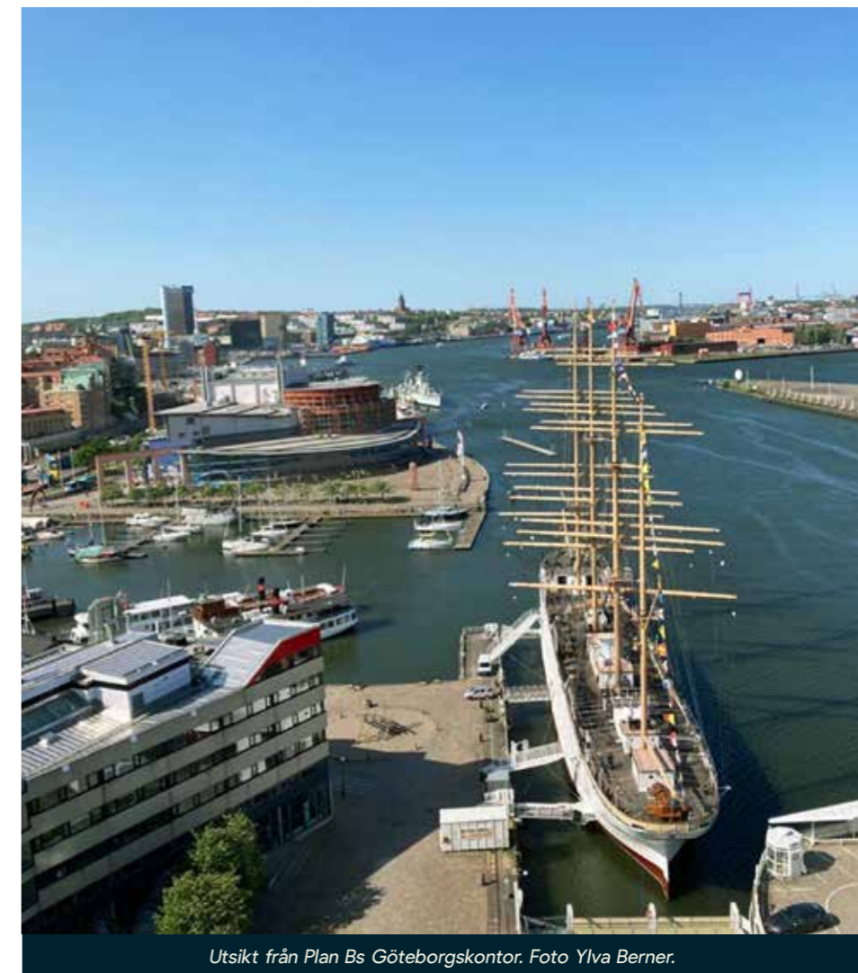
Utsikt från Plan Bs Göteborgskontor.

EU-kommissionen ger klartecken till en farledsförbättring av Göteborgs hamn. Viktigt för många delar av svensk industri och svenska försvarsmågan. https://www.goteborgshamn.se/Om-oss/nyhetsrum/#/pressreleases/eu-ger-klartecken-foer-farledsfordjupning-i-goteborgs-hamn-3291554