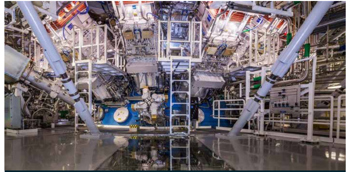
Det experimentella fusionskraftverket vid Lawrence Livermore National Laboratory i Kalifornien. Arkivbild.

Vehicle-to-grid (V2G): Göteborg Energi aviserar ambitionen att man kommer kunna få betalt för att hjälpa elnätet ansluta fler industrier i Göteborg. https://www.goteborgenergi.se/om-oss/press/pressmeddelanden/pressmeddelande/3285214/Pressmeddelande-Sa-kan-elbilar-starka-elnatet-Goteborg-Energi-i-flera-samarbeten-kring-fordon-till-nat-[V2G]