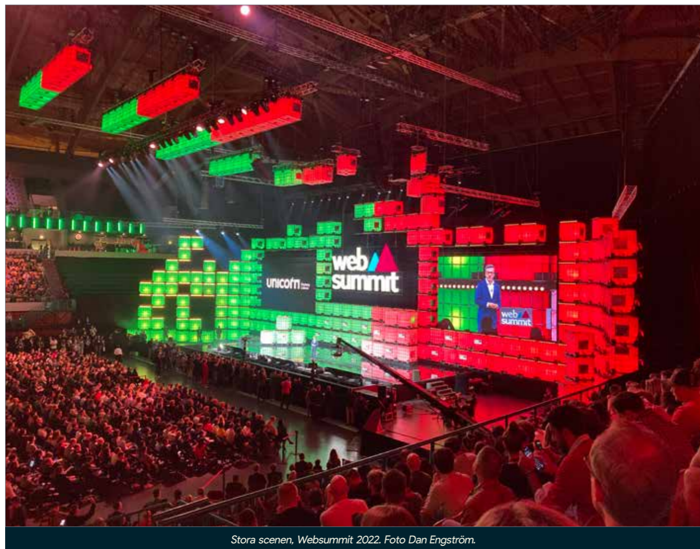
Stora scenen, Websummit 2022.

Websummit presenterar genom sitt magasin ett brett spektrum av ämnen, vilket speglar den komplexa naturen av dagens teknik- och samhällslandskap. Websummit 2024 är säkerligen värd ett besök. Vad tror ni, kommer det bli ett större inslag av spel på den konferensen? Ministerrådet har för första gången godkänt en rad slutsatser med titeln: "Att förbättra den kreativa och kulturella dimensionen av den europeiska videospelssektorn". Detta erkänner dataspelsindustrin som en prioriterad kreativ industri för EU.