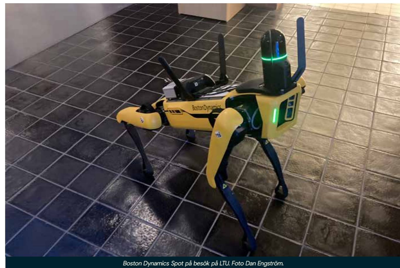
Boston Dynamics Spot på besök på LTU.